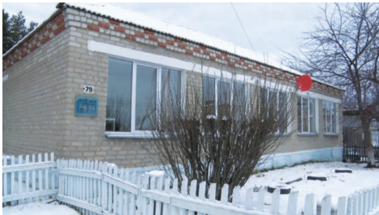
ФАП в селе Стриганском

СОВЕТ ВЕТЕРАНОВ Ирбитского РайПО и коллеги по работе