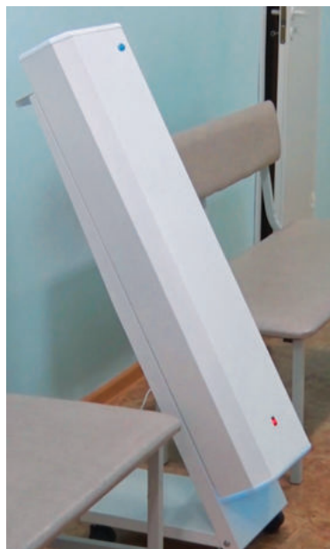
Тот самый рециркулятор воздуха